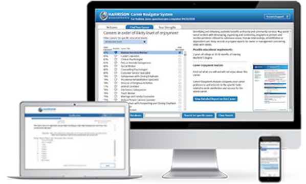
Çevrimiçi İnteraktif Kariyer Portalı